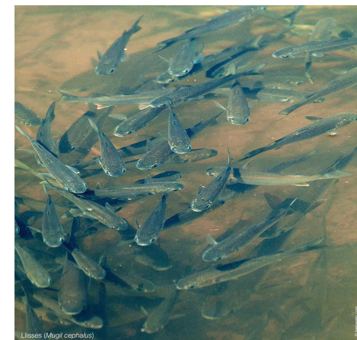
Llisas (Mugil cephalus)

En lo referente a flora, en la zona húmeda encontramos especies como la salicornia (Salicornia sp.), la verdolaga marina (Halimione portulacoides), el junco marí (Juncus acutius), el junco boval (Scirpus holoschoenus), la canya (Arundo donax) o el tamarell (Tamarix sp.).