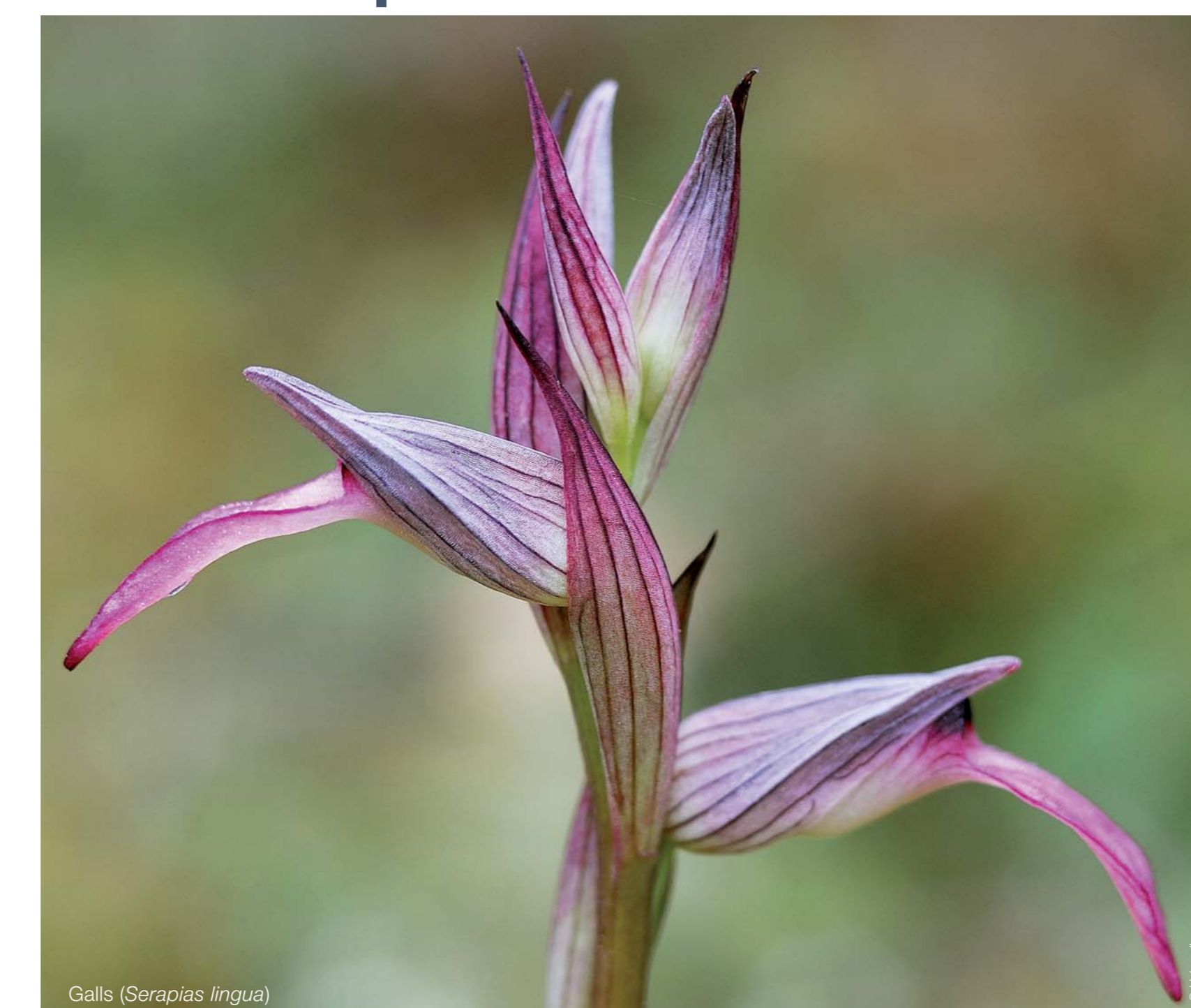
Galls (Serapias lingua)

La Gola és una petita zona humida situada a la desembocadura dels torrents de Siler i Gotmar. Aquesta, ates que és ampla i deprimida, facilita l'entrada i l'acumulació d'aigua salada procedent de la mar.